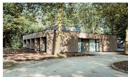
Crematieruimte 16 personen