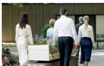
Begeleiding naar crematieruimte