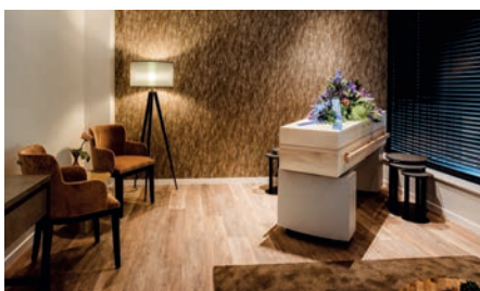
Familekamers De Merwede en De Oude Maas 6 personen