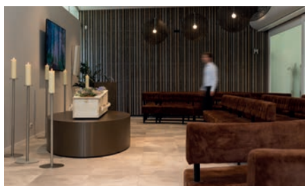
Aula 85 zitplaatsen