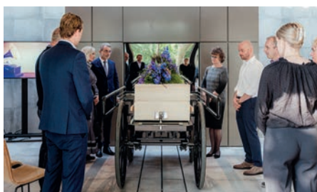
Laatste afscheid in crematieruimte tot 16 personen

Wij bieden u de mogelijkheid om de overledene over te brengen naar crematorium Minnendael met ons rouwvervoer. Het rouwvervoer houdt in een rouwauto en chauffeur, het plaatsen (inzetten) van de overledene in de rouwauto verzorgt u zelf. Binnen een straal van 20 km vanaf Minnendael wordt dit als service aangeboden en hierbuiten rekenen wij een toeslag van € 1,75 per km inclusief 9% BTW. De door u aangegeven besteltijd wordt aangehouden met een maximale uitloop van 20 minuten. Bij tijdsoverschrijding zijn wij genoodzaakt om het volledige tarief voor de rouwauto in rekening te brengen van € 290,00 inclusief 9% BTW.